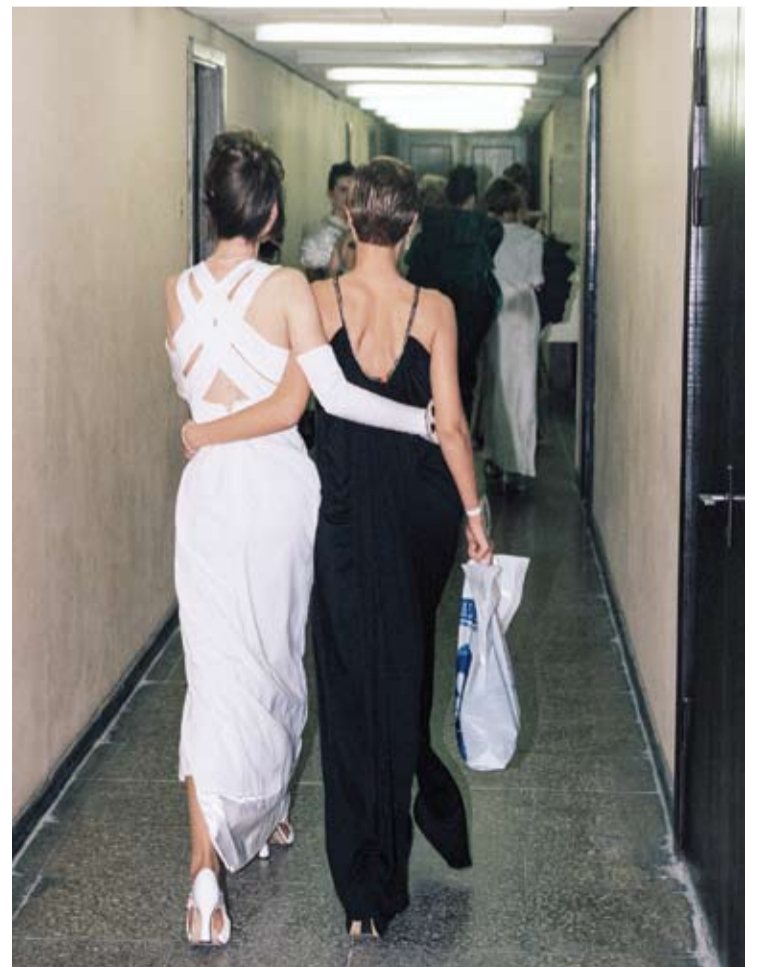
Mis Lietuva po konkurso Vilniaus sporto rūmuose. 1995 m.