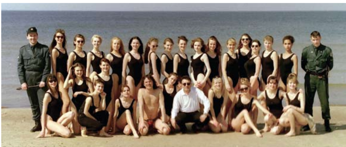
Mis Lietuva dalyvių repeticija Palangoje. 1995 m.