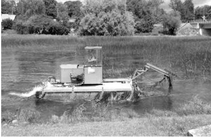
Upės augmenijai šienauti skirta amfibija per savo gyvenimą daugiau laiko praleido ant tralo keliaudama į remonto dirbtuves, nei upėje.