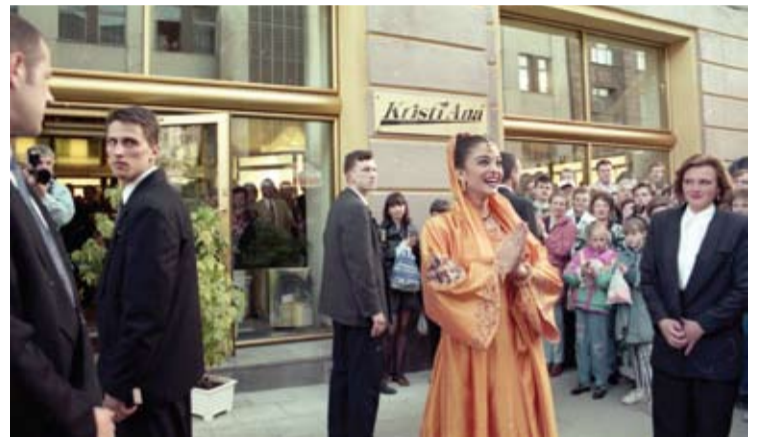
Mis pasaulis Aishwarya Rai Vilniuje. 1995 m.